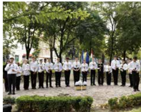
Az ünnepi műsort az erzsébetvárosi Baross Gábor Általános Iskola növendékei adták