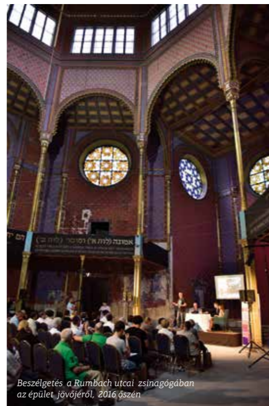
Beszélgetés a Rumbach utcai zsinagógában az épület jövőjéről, 2016 őszén

A Kőnig és Wagner Építész Iroda tervei szerint és a Laki Épületszobrász Kft. kivitelezésében megvalósuló, teljes épületgépészeti megújulással járó munkálatokat az állam mintegy 3 milliárd forinttal támogatja, amelynek köszönhetően várhatóan 2018 őszén megnyílhat a közönség előtt a különleges adottságokkal bíró, gyönyörű belvárosi épület.