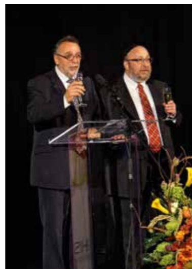
Erzsébetváros 2017. október 19.

A zsinagógai újév, vagyis a Rós Hosána ideje idén a Gergely-naptár szerint szeptember 20-a és 22-e közé esett, amikor a hívők az ember teremtésének 5778-ik évfordulóját ünnepelték. Ekkor vette kezdetét a tíz bűnbánó nap, amelyet az ún. Engesztelőnapon bõjt követett. Ebben az időszakban a hagyomány szerint ügyelni kell többek között a főzés és a tűzgyújtás tilalmának betartására, valamint a böjti előírásokra, amelyeket akkor is követni kell, ha az ünnep a sábosszel esik egybe. Az önmérséklet és bűnbánat idejét rendszerint több napos őszi ünnepsorozat követi. Mindazok, akik ebben az időszakban őszinte bűnbánatot gyakorolnak, megtisztult lélekkel köszönhetik az új kezdet reményével érkező újesztendőt.